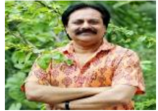
雷扎丁·斯大林(Rezauddin Stalin)，孟加拉国著名诗人，1962 年 11 月 22 日出生于杰索尔。达卡大学经济学学士和政治学硕士学位。纳兹鲁尔研究所(Nazrul Institute)的前副主任、孟加拉国著名的电视主播和媒体人物、孟加拉国表演艺术中心创始人兼董事长。

莫要念我 亲爱的—— 如果他 承诺你一部太阳金经， 我愿做你 母语中的字母排队。 如有人 可给你全世界的房子， 我只可 赠你一段长巾， 只为保护 你脆弱的甜美。