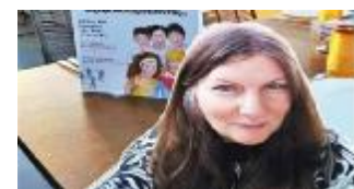
伊娃·彼得罗普鲁·利诺伊(Eva Petropoulou Lianoy)，出生于希腊的锡洛卡斯特罗。希腊著名女诗人、儿童文学作家。1994 年，出任法国《自由报》记者，2002 年回国。曾先后出版书籍和电子书：《我和我的另一个自我，我的影子》(塞塔出版社)、《杰拉尔丁和湖精灵》(英-法双语)、《月亮的女儿》【第四版】(希腊-英语，奥塞洛托斯出版社)等。

天空 亦在赠我信息， 我的眼前，出现自己。 你的眼神 亦望那里， 同样的天空下， 两颗心 翩跹， 我心 狂噓。 哦莫再 给我讯息， 我仍 深爱着你。 然此 情怀已逝， 躯壳里，满是 错误， 带着愤怒，还有 失去， 愈是明白 愈会哭泣。 哦请你 莫再给我讯息， 就当 从未发生过， 虽然 我还深爱着你。