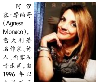
阿涅塞·摩纳哥(Agnese Monaco)，意大利著名作家、诗人、画家和音乐家，自 1996 年以来活跃于文坛。多次与意大利音乐界的知名人士合作，为两部喜剧创作诗歌、小说、寓言和音乐文本，其中包括一部关于抑郁症致病源的短片《Redini di vita》。她的俳句、格言、散文、评论，被翻译成英语、法语、西班牙语等出版，并多次于意大利以及其他国家获奖。

烈火之间， 心犹坦然。 翻开一页， 痛之本源。 生无终点。 初始所在， 寻可追前。