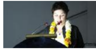
叶西姆·阿高格鲁(Ye im Aolu)，土耳其著名诗人、作家、编辑。1966 年生于伊斯坦布尔，就读于伊斯坦布尔大学考古与艺术史系，获伊斯坦布尔大学广播电视大学传播系文学硕士学位。曾在纽约视觉艺术学院进修了使用 Super 8 摄影机拍摄的电影课。自 18 岁起，开始发表诗歌。现在土耳其出版有七本诗集。