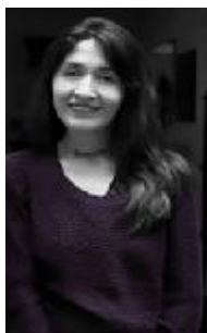
苏玛·蒙特罗(Sulma Montero)：玻利维亚著名女诗人，在文学、艺术和设计方面有相当的造诣。出版有书籍：《有娃娃的女人》、《童年》、《塔尼亚花》、《奇思妙想》、《亲密选集》(诗集)、原装(故事集)、瑟瑞娜(小说集)等。

于金色蜂蜜样光芒下， 无穷无尽的风景令我沉迷。 在黎明伸展着花冠到来时， 橙色美丽的一天即将到来， 于蓝色之阴影中， 我感觉得到 我的灵魂在秘密呼吸。