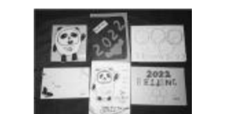
美术、音乐学科也根据学科特点展示冬奥会开幕式和比赛过程的中国的风采

英语用英文书写冬奥会的口号“Together for a Shared Future”(中文:一起向未来),并制作贺卡的形式宣传北京冬奥会。