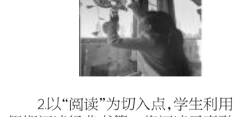
2. 以“阅读”为切入点,学生利用假期阅读经典书籍,将阅读元素融入寒假作业中,感受中华优秀传统文化的独特魅力。