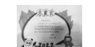
每个学科分别通过不同形式了解冬奥会,希望每一名同学都成为冬奥会的参与者与受益者,帮助孩子们度过一个充实又快乐的假期。

二、语文创意作业。1. 劳动教育是小学教育中不可缺少的重要组成部分,寒假期间,学校为三年级的孩子们准备了劳动“菜单”